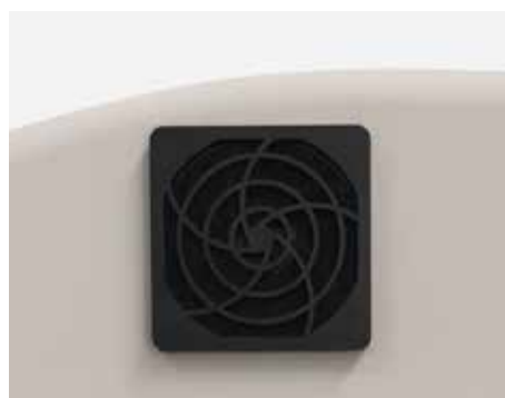
VENTILADOR EXTRACCIÓN AIRE (SC202MHD)

Actualizados a central 230 Vac CT102B con pantalla integrada