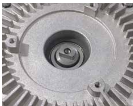
MOTORES ROBUSTOS Y DE ALTAS PRESTACIONES