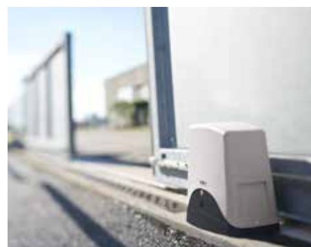
PARTES ELECTRÓNICAS BIEN PROTEGIDAS DE LOS AGENTES EXTERNOS